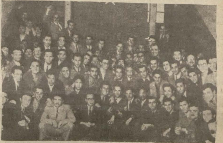
Parti Talebe Yurdundaki gençlerden bir kısım.

On günlük tetkiklerden çıkan 7 netice ve bir hüküm: Bir kısım memleket gençliği İstan-bulda hakikaten müşkül şart'ar içinde okuyor Röportajı yapan: Nusret Safa Coşkun