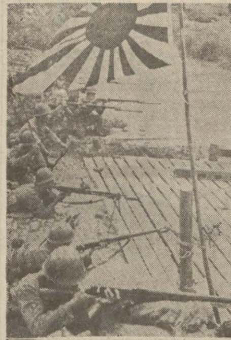
Japon kuvvetlerini harb sahalarında gösteren üçü sayını dikkat resim

Vişi, 3 (A.A.) — Sofyadan al-nan bir habere göre 20 ile 45 yaş-ları arasında 3200 Yahudi demir-yolları inşaatında çalışmak üzere nafia hizmetine alınacaktır.